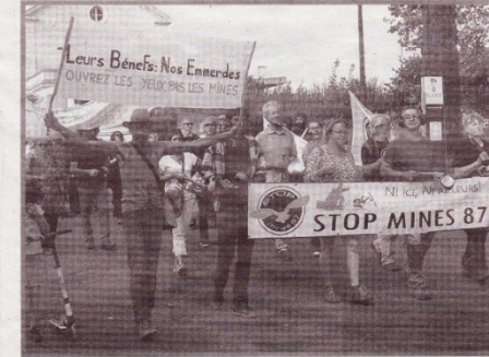
Lors de la dernière mobilisation en octobre dernier à Saint-Yrieix.

Après 3 ans d'existence, l'association Stop Mines 87 reste mobilisée pour obtenir des réponses de la préfecture concernant ses craintes sur le projet minier qui affecterait le territoire aurifère du sud de la Haute-Vienne.