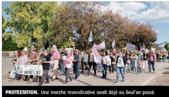
PROTESTATION. Une marche revendicative avait déjà eu lieu l'an passé.

Après trois ans d'existence, Stop Mines 87 reste mobilisé pour obtenir des réponses de la préfecture concernant ses craintes sur le projet minier qui affecterait le territoire aurifère du sud-Haute-Vienne. L'association, composée de 200 citoyens est soutenue par des associa-