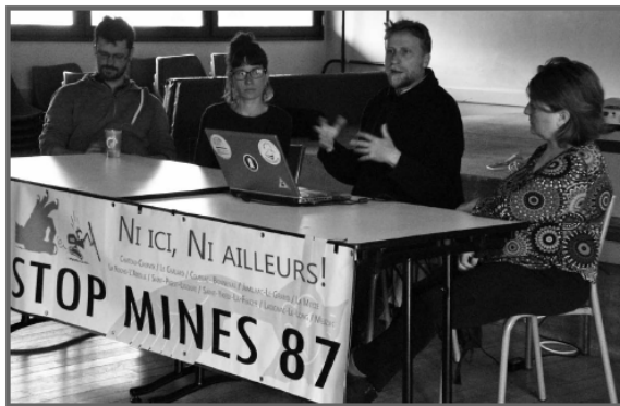
Face aux nouvelles menaces de pollution sur le territoire, Stop Mines 87 ne désarmera pas.

Un acte officiel entérinant l'abandon du projet d'exploitation aurifère porté par la société Cordier Mines sur dix communes du sud de la Haute-Vienne et la Dordogne : c'est ce que demandent au préfet les membres de l'association Stop Mines 87 qui tenait son assemblée générale samedi à Château-Chervix, en présence du maire de la commune.